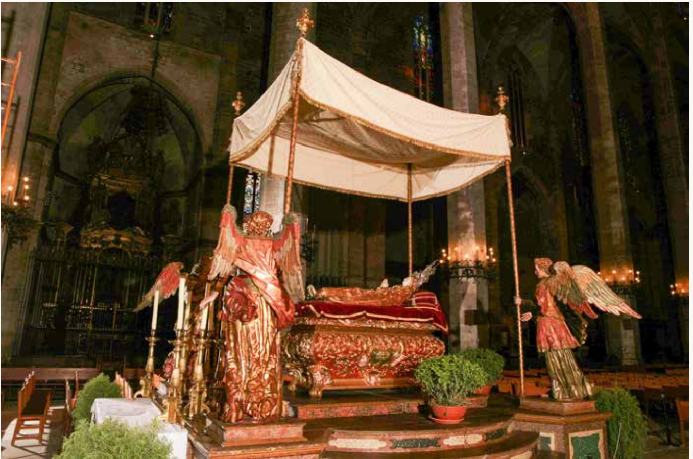
Tàlem marià de la Seu; un moble del segle XVII per a una estàtua jacent del segle XV.

La festivitat de l'Assumpció encara manté els elements purs, principalment en les comunitats espirituals com ara els convents femenins de clausura i